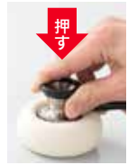
強くあてると高周波音(中高音)