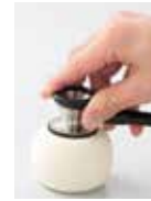
軽くあてると低周波音(低音)