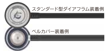
スタンダード型ダイアフラム装着例