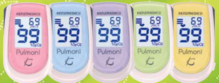
コーラルピンク ペールブルー ライラック リーフグリーン レモンイエロー