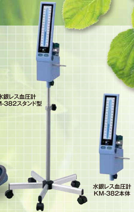
水銀レス血圧計 KM-382本体